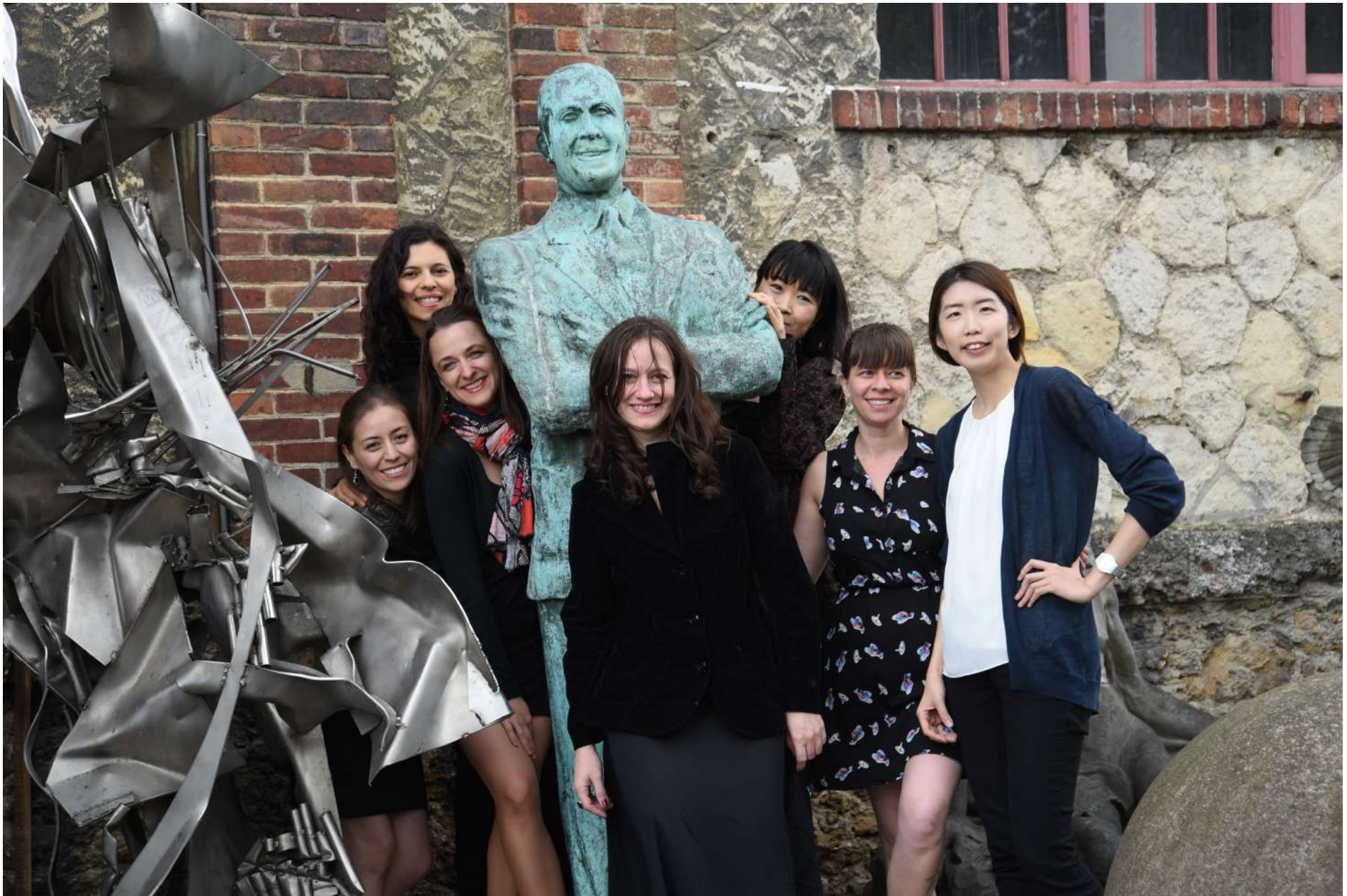
Estatua de Carlos Gardel en el Depósito de Obras de Arte de la Ciudad de París, Ivry-sur-Seine, Francia